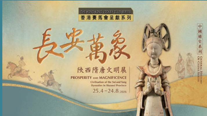
《唐古百戲》帶領觀眾穿越千年，體驗大唐盛世的雜技盛筵。