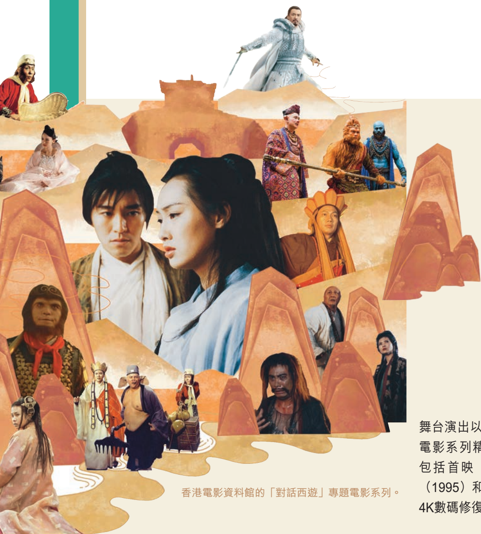
香港電影資料館的「對話西遊」專題電影系列。

由香港歷史博物館籌劃、香港賽馬會慈善信託基金獨家贊助的「香港賽馬會呈獻系列：長安萬象——陝西隋唐文明展」，展出逾165件（套）陝西及香港文物，讓觀眾透過珍貴文物感受隋唐兩代的璀璨，饗覽長安的精緻繁華。