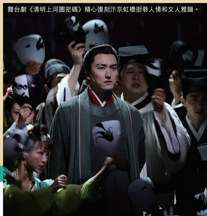
舞台劇《清明上河圖密碼》精心復刻汴京虹橋街巷人情和文人雅韻。

同樣橫跨古今的，還有「弦微真趣——姚公白古琴音樂會」。國家級非遺項目古琴藝術首批代表性傳承人姚公白，會在是次音樂會中，首次公演古琴譜集《指法匯參確解》（1821）版本中的琴曲《流水》，讓大家沉浸於古琴新聲之中，共歷一場穿越古今的文人雅集。