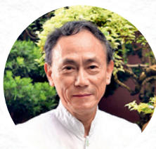
▲ 姚公白將首演古琴譜集《指法匯參確解》（1821）版本的《流水》。

文化節期間，一眾藝術家將展現中華文化的傳統精髓與當代魅力。國家級非遺項目古琴藝術代表性傳承人姚公白於「弦微真趣」古琴音樂會，將首演古琴譜集《指法匯參確解》（1821）版本的《流水》；編舞家鄒小強結合傳統舞蹈與現代科技的舞作《旋》則呈現中國舞與數碼科技的對話；榮獲國家藝術基金資助的音樂劇《玉良》，融合多元藝術媒介，演繹中國首位女西洋畫家潘玉良的故事，細膩糅合東西方美學；同樣獲國家藝術基金支持的唢呐演奏家馬璋謙則攜手樂隊「爵躍」，在《DidaBoy的尋「樂」人生》音樂會中，以爵士樂、唢呐及喉管的創新組合，奏響傳統新聲。