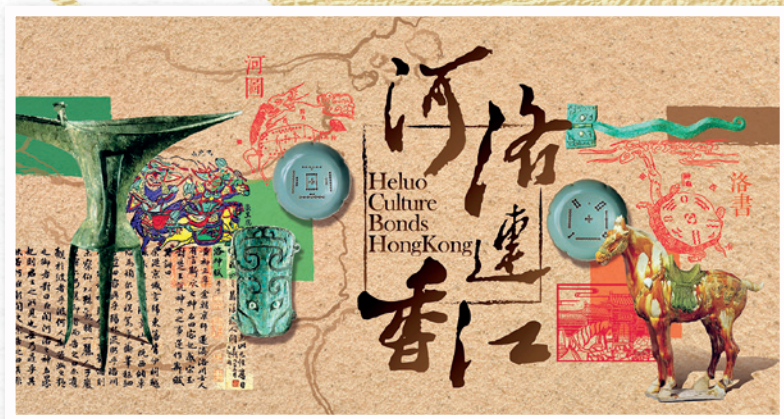
▲ 「河洛連香江」展覽讓河洛文化在香港綻放新生。