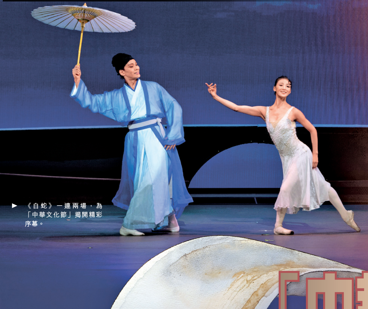
《白蛇》一連兩場，為「中華文化節」揭開精彩序幕。

從古至今，傳奇故事以不同形式流傳，在不同時代綻放異彩，成就代代藝術經典。今年夏天，由文化體育及旅遊局呈獻、康樂及文化事務署策劃的旗艦文藝品牌項目「中華文化節」，將透過逾280場舞台精品節目及延伸活動，為市民和旅客帶來古今交融、耳目一新的中華文化體驗。