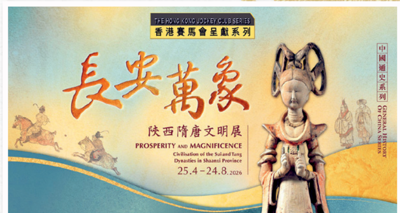
▲ 「香港賽馬會呈獻系列：長安萬象——陝西隋唐文明展」精選逾165件／套陝西及香港文物。

現大氣開放、崇新勇進、樂觀自信的國家氣度，讓觀眾饕餮長安的精緻繁華，並了解隋唐時期香港的商貿及軍事關要。展覽教育互動區則透過趣味展示和多元活動，讓觀眾認識隋唐風華。大家可參與《壁畫那邊是唐朝》虛擬實境體驗活動，「穿越」壁畫回到唐朝，置身馬球賽事和遊走宮城；又可登上《歌舞昇平》沉浸式互動舞台，隨大唐樂隊翩翩起舞。