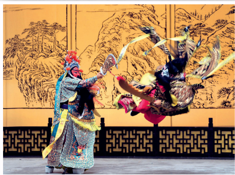
▲ 中國戲曲節以「義薄雲天·滿台忠義」為主題，為觀眾帶來傳奇人物故事。

作為文化節重要一環，中國戲曲節2026以「義薄雲天·滿台忠義」為主題，匯聚頂尖演員，為觀眾帶來京劇、豫劇、河北梆子、上黨梆子及粵劇不同劇種的傳奇人物故事，展現忠肝照世、義氣凌雲的浩然風骨。崑劇則以夢為引，透過抒情細膩的身段和唱腔，呈現人生如寄的深層意境。6大戲曲劇種立體展現中華文化多元一體的特質。