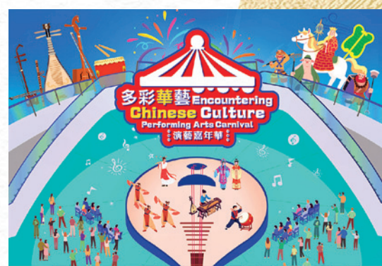
▲ 《多彩華藝》演藝嘉年華免費入場，讓市民近距離感受中華文化藝術之美。

過去兩屆吸引逾3萬人次參與的《多彩華藝》演藝嘉年華，今屆將繼續透過精選舞台節目選段及非遺表演藝術演出，讓市民免費近距離感受中華文化藝術之美。演藝嘉年華並配合巡迴展覽，為家庭觀眾締造更多共賞中華文化的美好時光。「中華文化節」節目精彩紛呈，上述僅為部分精選節目及活動，更多節目詳情及購票優惠，請瀏覽文化節網站。